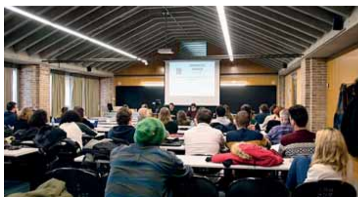
Una de les sessions de la jornada ■ LES GOLFES / COESPAL

Les jornades Espais al marge. Polítiques culturals, creativitat i cultura lliure sorgeixen de la voluntat de confrontar la pràctica artística amb les idees que s'articulen des de les institucions i l'hegemonia cultural, entenent l'hegemonia com una construcció discursiva que, acompanyada d'una difusió necessària, es converteix en el recurrent "sentit comú". La idea cultural que analitzen aquestes jornades està vinculada a tres de les concepcions més consolidades a la societat